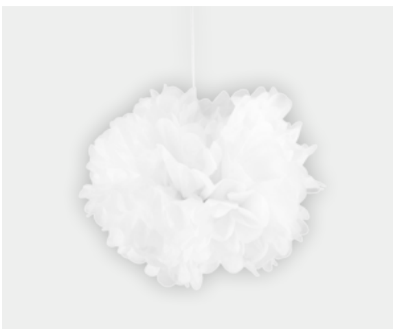
6. Pompon blanc pour apporter une note de candeur. 20cm ou 30cm - 20 coloris à partir de 1,95€ le lot de 2.