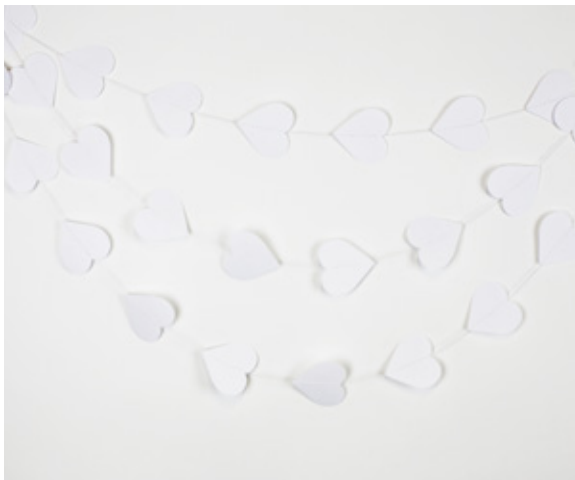
4. Guirlandes en papier blanc. Forme rond ou cœur, à parsemer à volonté ! 40 pièces. Long. 5 m. Disponible en mars. 4,50€