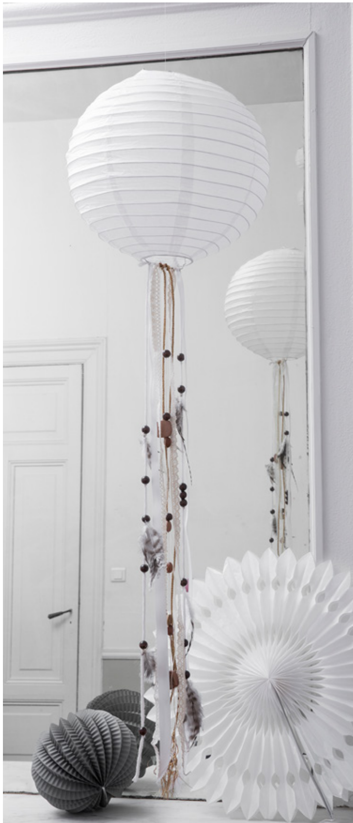
7. Boule japonaise à suspendre. À partir d' 1,20€. Diamètre 10, 20, 30 40, 50 ou 60cm. Large choix de coloris. Possibilité de la customiser avec des rubans ! 3,30€.

Toutes ces références sont disponibles sur skylantern.fr